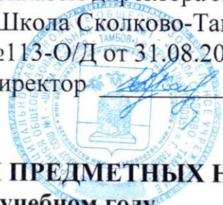
ГРАФИК ПРОВЕДЕНИЯ ПРЕДМЕТНЫХ НЕДЕЛЬ в 2018/2019 учебном году