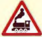
железнодорожный переход без шлагбаума