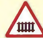
железнодорожный переход со шлагбаумом